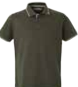
51 BOTTLE GREEN