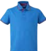
06 AZZURRO ROYAL