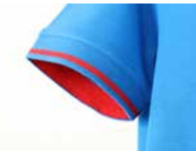
giromanica a costina di colore a contrasto