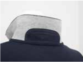
inserto nel sottocollo per eventuale personalizzazione