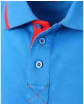
collo chiuso con 3 bottoni