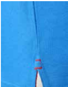
spacchetti laterali al fondo di colore a contrasto