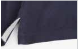
spacchetti laterali al fondo di colore a contrasto