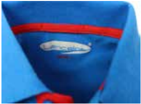
fascia parasudore e bottoniera di colore a contrasto